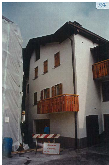
DOCUMENTAZIONE FOTOGRAFICA 2008 (RIF. B 84)