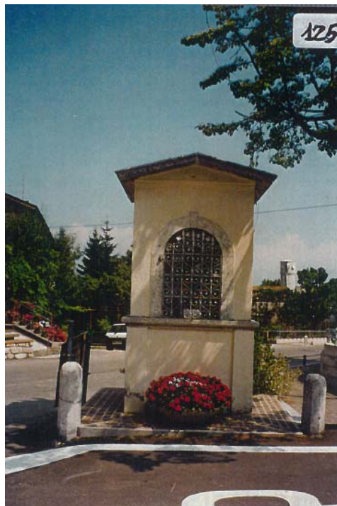
DOCUMENTAZIONE FOTOGRAFICA 2016