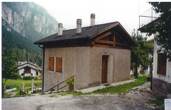
DOCUMENTAZIONE FOTOGRAFICA 2016