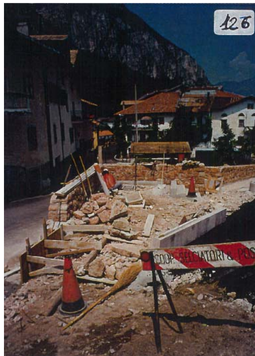
DOCUMENTAZIONE FOTOGRAFICA 2016